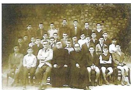
La classe de sixième en 1960

La chapelle fut d'abord confiée aux Pères Récollets de Sommières jusqu'à la révolution ; des ermites se succéderont sur le site, vivant dans une grotte toujours visible sous la chapelle.